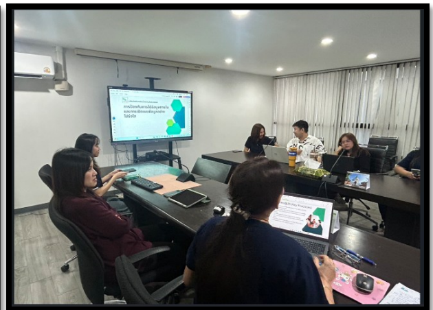
ภาพตัวอย่างการจัดอบรม

ในปี 2568 จากการติดตามผลหลังการเผยแพร่นโยบายและการอบรมให้ความรู้พนักงานเรื่อง จรรยาบรรณทางธุรกิจ : การป้องกันการรั่วข้อมูลภายในเพื่อแสวงหาผลประโยชน์