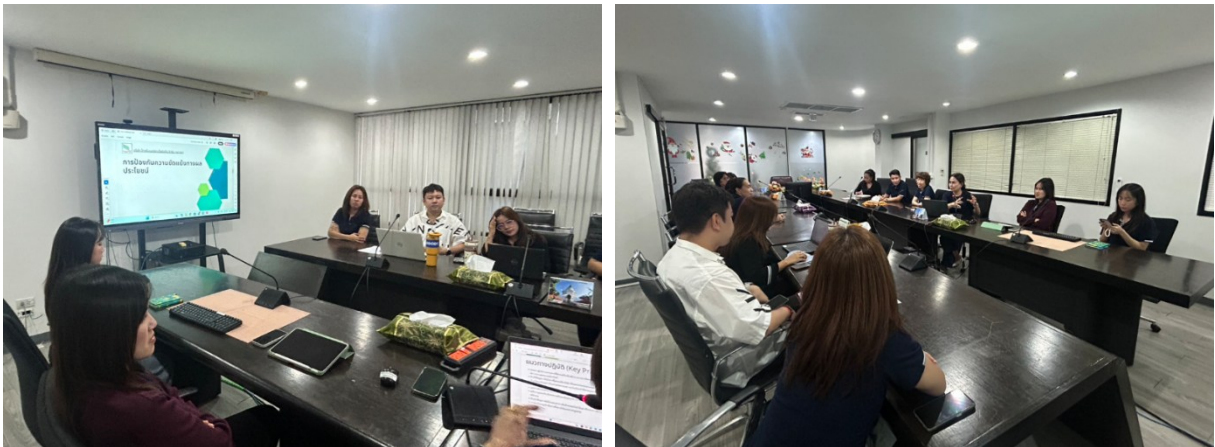
ภาพตัวอย่างการจัดอบรม

ในปี 2568 จากการติดตามผลหลังการเผยแพร่นโยบายและการอบรมให้ความรู้พนักงานเรื่อง “จรรยาบรรณทางธุรกิจ:นโยบายและแนวทางปฏิบัติเกี่ยวกับความขัดแย้งทางผลประโยชน์